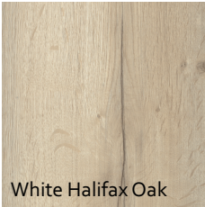
White Halifax Oak